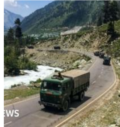
인도 Ladakh 주 중국접경 고도 4150 m 길이 65 km의 Galwan 강 지역에서 인도-중국간 국경 분쟁 2020년 6월 16일 유혈 충돌

1. 인도는 전후 전통적 제3세계 비동맹 운동 (Non-alignment Movement) 견지=>미·중 격돌시대 이후 사안별 Minilateralism 등 다변적 동맹정책 등 (Multi-alignments) 추구