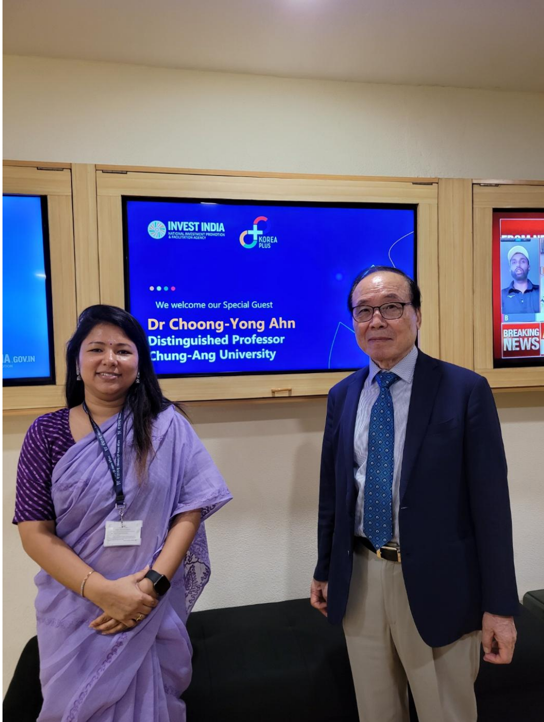
Invest India 에서 외투기업 사후관리 제도 강연 이후 (2023 년 8월 28일)